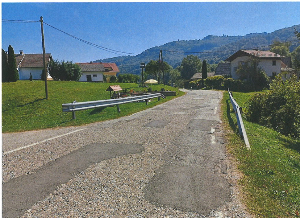
Slika 1: Pogled iz smeri Majšperka