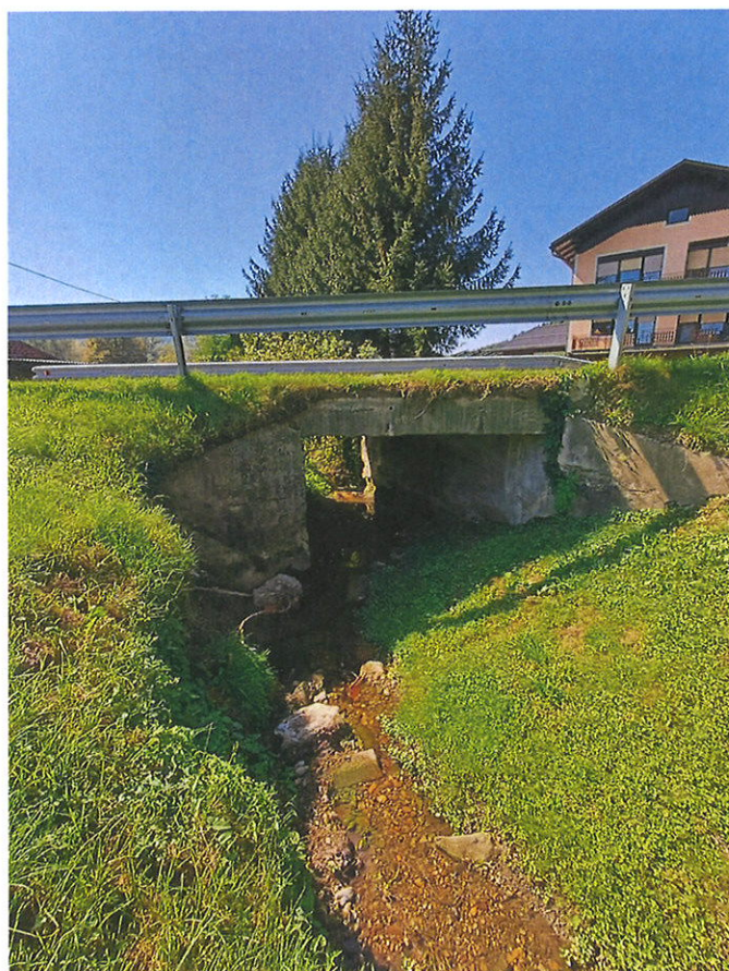
Slika 2: Pogled dolvodno vodotoka