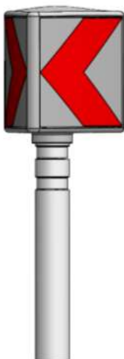
Prikaz obojestranskega znaka 3312 in 3312-2 »Usmerjanje prometa v ovinkih« na PVS