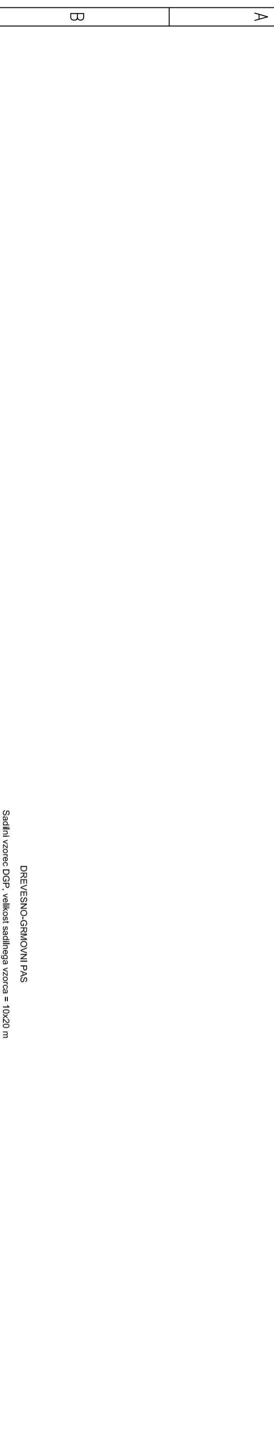
DREVESNO-GRMOVNI PAS Sadilni vzorec DGP, velikost sadilnega vzorca = 10x20 m